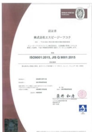
画像をクリックすると拡大表示されます